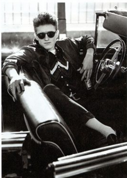
Nella pagina a fianco: T-shirt con collo a spetto in piqué di cotone, Hermès . Giacca in pelle, mocassini, tutto Tefé; camicia stampata, Aesé ; T-shirt, Acne Studios ; pantaloni, Acne ; occhiali da sole, Web Eyewear ; cintura, Orlani ; anello, Manuel ; Bezzi ; calze, Calze Red .